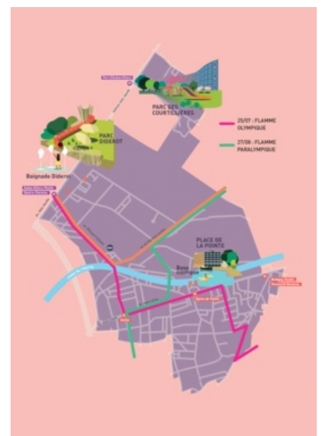
Parcours des flammes olympiques et paralympiques à Pantin

https://www.pantin.fr/la-ville/a-ne-pas-manquer-agenda/pantin-senflamme-5622