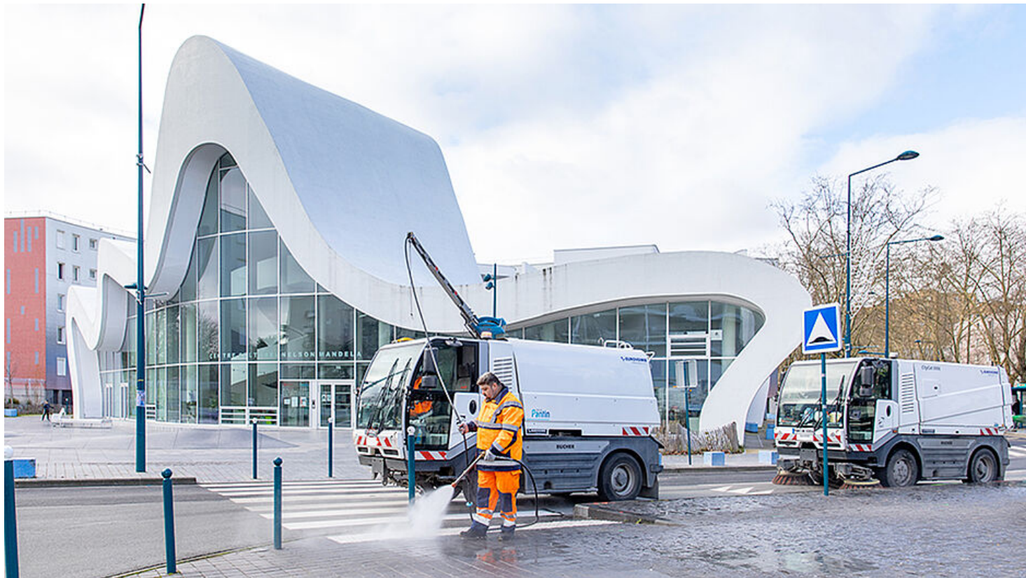
Chaque jour, 50 agents municipaux entretiennent les rues et parcs de la ville.

Chaque année, Pantin transforme aussi en compost l'intégralité de ses déchets verts, soit 350 tonnes, et un mètre cube de paillettes argentées de café collectées auprès d'un torréfacteur local. Elle récupère également 55 tonnes de drêche (résidu de brassage) dans les brasseries locales pour nourrir et pailler ses sols ; soutient l'expérimentation de compostage de couches menée par les Alchimistes et lutte, grâce à l'installation de tables de tri, contre le gaspillage alimentaire dans ses cantines.