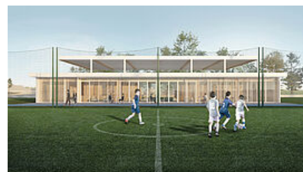
Sport dans la ville

Au programme : du foot, surtout, mais aussi du rugby, des entraînements et des tournois. Un nouveau bâtiment accueillera, en outre, un terrain de basket couvert et une salle polyvalente où l'on pourra pratiquer la danse ou la boxe.