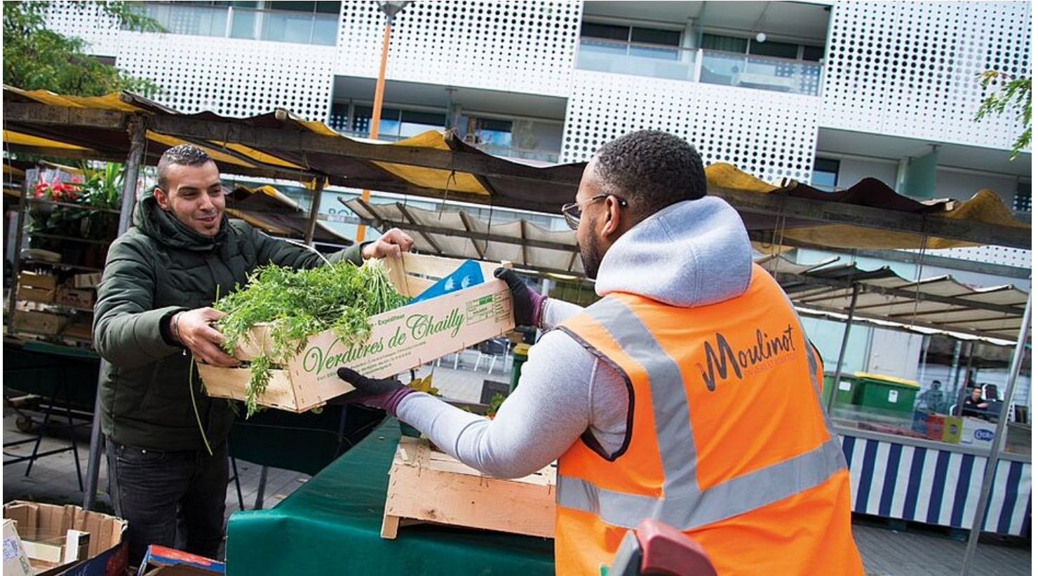
Gestion des biodéchets au marché Olympe de Gougues

À quelques centaines de mètres de là, au marché des Quatre-Chemins , trônent, sur le parking, deux compacteurs géants, capables de récupérer 18 tonnes de déchets spécifiques.