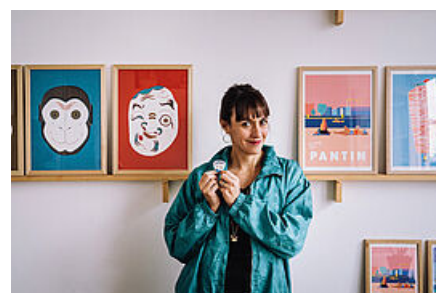
Émilie Sarnel

Nichée rue Beaurepaire, la petite échoppe d'Émilie Sarnel est un concentré de créativité. La graphiste et illustratrice, qui expose à la Slow Galerie de Paris, y propose des impressions à l'encre pigmentaire, des risographies et des sérigraphies en tirages limités. La série Greetings from Pantin revisite la ville en version pop art. Dans son univers, les broches de kebab se transforment en tours et les cygnes se rêvent licornes. L'artiste a aussi créé des broches et magnets en céramique à petits prix. Les cale-portes figuratifs créés par son mari designer réjouiront aussi les amateurs de cadeaux originaux.