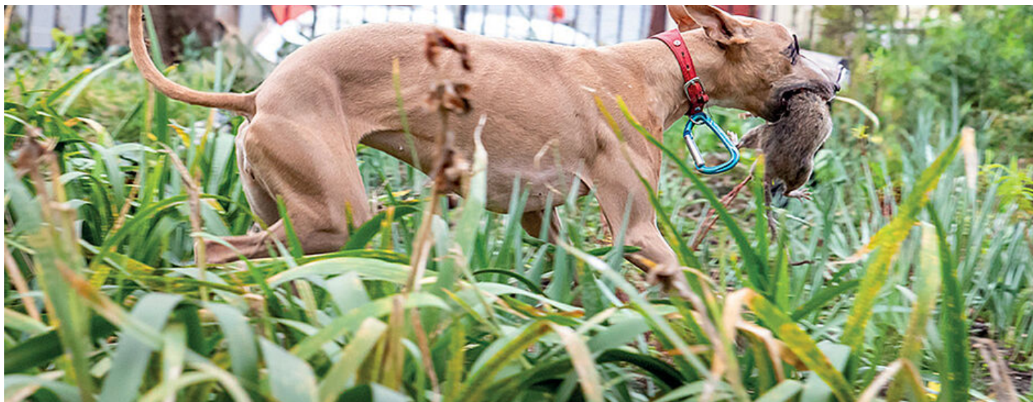
La dératisation à l'aide de chiens et de furets est plus efficace que celle utilisant des produits chimiques.

Au vu du nombre important de rats capturés, d'autres interventions de ce type sont prochainement prévues au sein des parcs Diderot et de La Manufacture. « Nous programmerons sans doute des opérations nocturnes puisque les rats sortent davantage à la tombée du jour », conclut Mohammed Bibi.