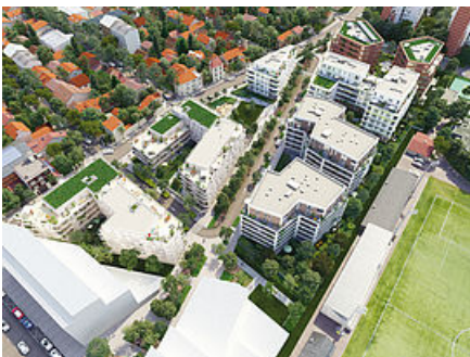
Quartier Les Pantinoises

Un nouveau quartier de 30 000 m 2 est sur le point d'éclorre en lisière des Courtillières. L'ensemble, baptisé Les Pantinoises, sera desservi par une voie débouchant sur la rue Édouard-Renard. Composé de six immeubles, il comprendra 355 appartements, du studio au 5 pièces, tous proposés en accession à la propriété à prix maîtrisés.