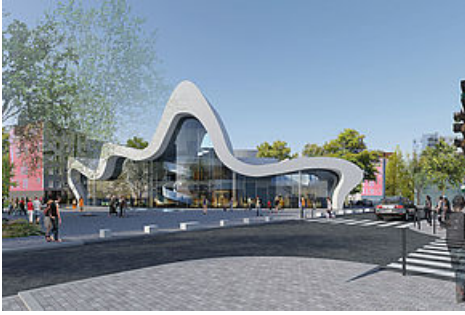
Équipement culturel Nelson Mandela