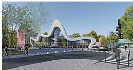
Équipement culturel Nelson Mandela