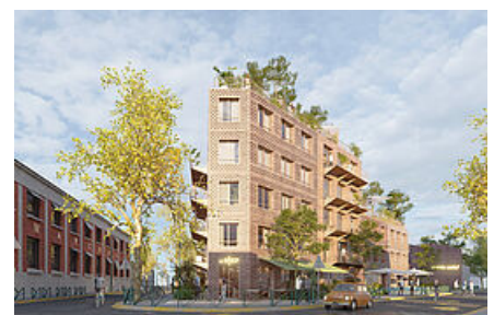
Green Sheds

Rue Paul-Bert, ce programme immobilier, mixant réhabilitation et construction, accueillera ainsi des logements sociaux et en accession à la propriété, le siège social de la maison de prêt-à-porter Majestic Filatures et des commerces. Une crèche départementale de 55 berceaux pourrait