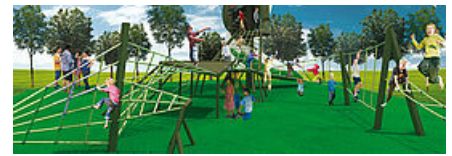
Îlot 27

À noter que la ville présentera cette année un projet amendé pour la requalification de la dalle de l'Îlot 27, et ce, afin d'obtenir une augmentation du financement de l'Agence nationale de rénovation urbaine (Anru).