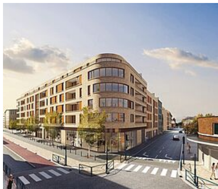
Nouvel immeuble rue Hoche

À l'angle des rues Candale et Méhul, sur une emprise de 3 182 m 2 , un immeuble de 17 logements en accession à la propriété et des commerces, dont une épicerie bio et une boulangerie pédagogique, verra le jour en 2024. Joutant ce bâtiment, une école internationale de gestion hôtelière et de restauration proposera des cursus où les élèves mettront en pratique leurs connaissances au sein d'un restaurant d'application ouvert à tous et... sur un toit où pousseront des fruits et légumes. Le permis de construire de cet ensemble immobilier, lauréat de l'appel à projets Inventons la métropole du Grand Paris 2, sera déposé en mars.