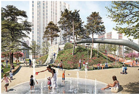
Parc Diderot