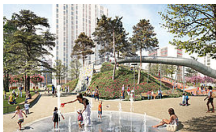
Parc Diderot

Si son ouverture a été retardée suite à des opérations de dépollution des sols puis à cause du confinement, une partie du parc Diderot sera enfin accessible au public cette année.