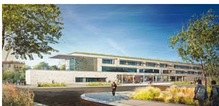
Collège Jean-Lolive © EPICURIA Architectes

L'écoquartier est appelé à se développer sur une emprise de 45 hectares, entre le secteur de la mairie et les Quatre-Chemins. Le nouveau collège Jean-Lolive, assorti de sa nouvelle voie de desserte, en sera la figure de proue et devrait ouvrir ses portes à la rentrée prochaine.