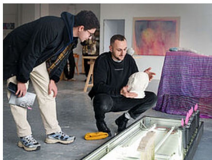
Atelier Chez Kit

Si les Quatre-Chemins comptent aujourd'hui plus de 40 ateliers, c'est grâce à la conviction d'Aline Archimbaud, alors adjointe au maire déléguée à l'Économie solidaire, qui créa le pôle des Métiers d'art au tournant de l'an 2000. « Il s'agissait, précise-t-elle, de réhabiliter des rez-de-chaussée abandonnés et un peu délabrés pour les louer à de jeunes artisans, à des prix très inférieurs à ceux du marché. Nous voulions requalifier ce quartier grâce à des activités de qualité, en y apportant du beau, voire du très beau. Les artisans d'art sont des figures socialement très intéressantes car passionnées. Ce sont des passeurs qui renvoient aux habitants une image très positive. »