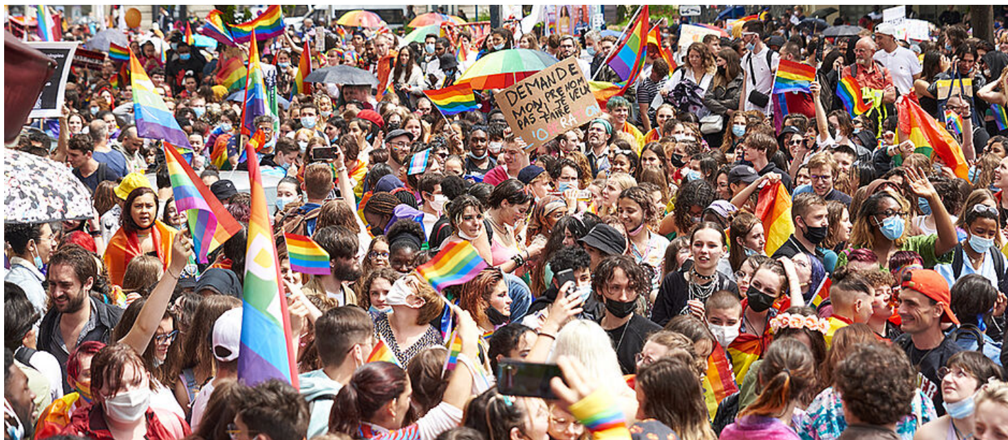
Le 26 juin 2021, pour la première fois, la Marche des fiertés s'élançait depuis une ville de banlieue : Pantin.

Leur objectif ? « Proposer des moments engagés et joyeux ouverts à toutes et tous pour militer, fédérer la communauté lesbo-queer, les alliés mais aussi les curieux-ses. »