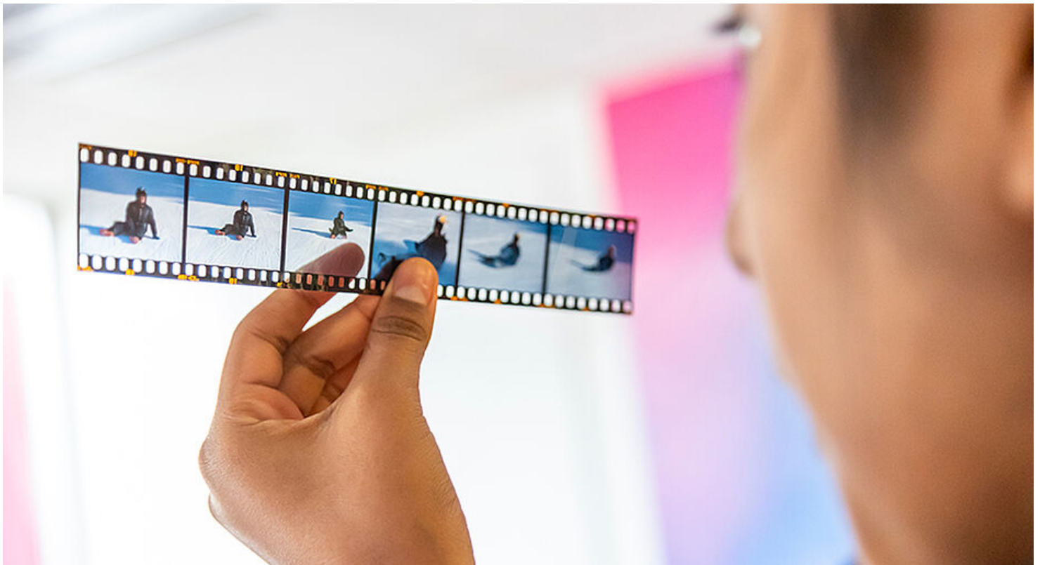
Atelier Artagon - Cité Éducative

Ils y venaient déjà régulièrement jouer au ping-pong et au baby-foot, ou simplement pour passer le temps. Grâce aux Mercredis d'Artagon, dernier-né des projets de la Cité éducative, co-financé par Est Ensemble dans le cadre de la politique de la ville, ces adolescents découvrent désormais, dans l'ancien collège Jean-Lolive, de nouvelles activités préparées par les artistes résidents. Ainsi, ce mercredi de mars, ils s'essayaient au cyanotype, un procédé de développement photographique.