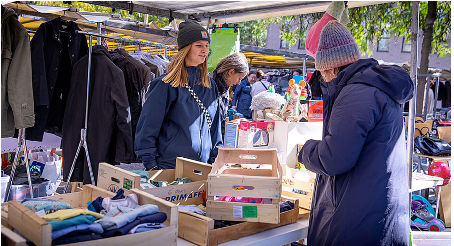
Vide-greniers - 2024