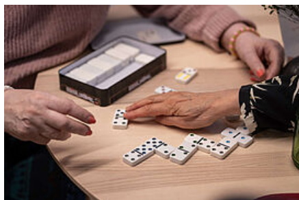
(Re)trouvailles - La Seigneurie

Cette « bouffée d'air », ce « refuge » doté d'une grande terrasse, c'est le café solidaire Papot'age, partie intégrante de (Re)trouvailles, le nouveau tiers-lieu de La Seigneurie, qui comprend également un jardin partagé de 200 m 2 , désert en ce frisquet jour d'automne. Le café, en revanche, fait salle comble pour le concert du groupe Salt&Pepper, honoré de la présence d'un jeune couple et de son bébé.