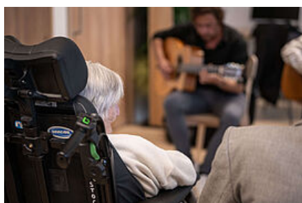
(Re)trouvailles - La Seigneurie